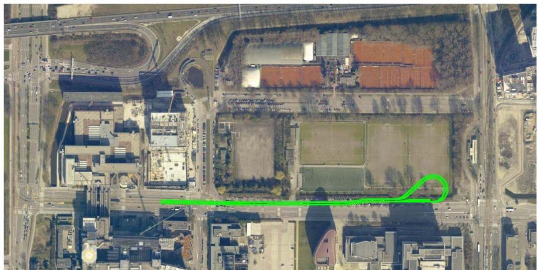
Foto: locatie nieuwe tramlus ten zuiden van het meest oostelijke veld van SC Buitenveldert

Met oog op de bereikbaarheid van Zuidas krijgen de tramlijnen 16 en 24 een ander tracé. Dit houdt in dat de tram vanaf de De Boelelaan niet meer zal afbuigen naar de Mahlerlaan maar ter hoogte van Sportclub Buitenveldert in de De Boelelaan rechtdoor zal gaan. Vlakbij de kruising De Boelelaan / Buitenveldertselaan zal daarom een nieuwe tramlus worden aangelegd. Zie onderstaande afbeelding voor de locatie van de nieuwe tramlus.